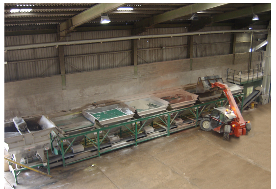
6 бункерный смеситель Вейконт

несколько компьютеров. Таким образом, оператор полностью контролирует процесс и качество смеси. На каждом бункере устанавливается экран, информирующий о типе продукта и весе на настоящий момент. При смешивании, бункеры одновременно выгружают продукт, это означает, что все материалы поступают на центральный передаточный транспортер в одно и то же время. При необходимости может быть установлен дополнительный смешивающий шнек, на который происходит разгрузка материалов из центрального транспортера. Смеситель может быть оборудован неограниченным количеством бункеров объемом от 4 до 12 тонн. Производственная мощность смесителя зависит напрямую от количества бункеров. Конфигурация может изменяться в зависимости от пожеланий заказчика.