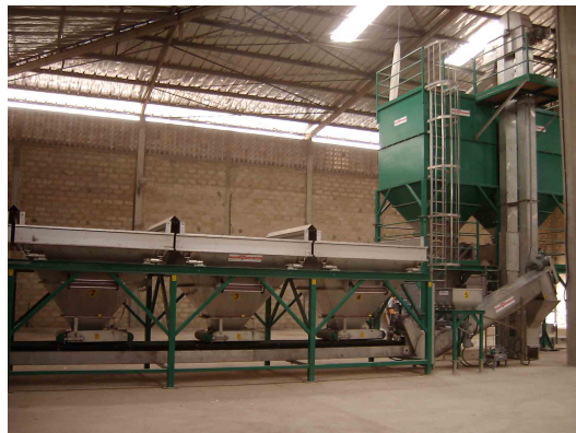
3 бункерный смеситель Вейконт + линия затаривания для малых мешков

Смеситель с системой непрерывного взвешивания Вейконт подходит для работы с порошковыми и гранулированными материалами. Машина смешивает исходные материалы в смесь превосходного качества. Готовая смесь может быть выгружена и