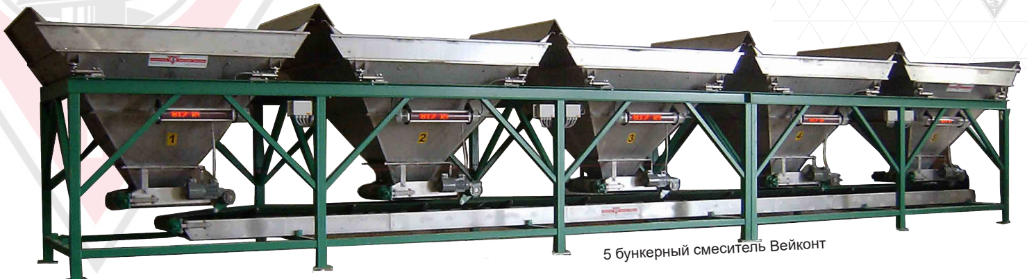
5 бункерный смеситель Вейконт

Производственная мощность от 20 до 120 тонн/м3 в час неограниченное количество бункеров