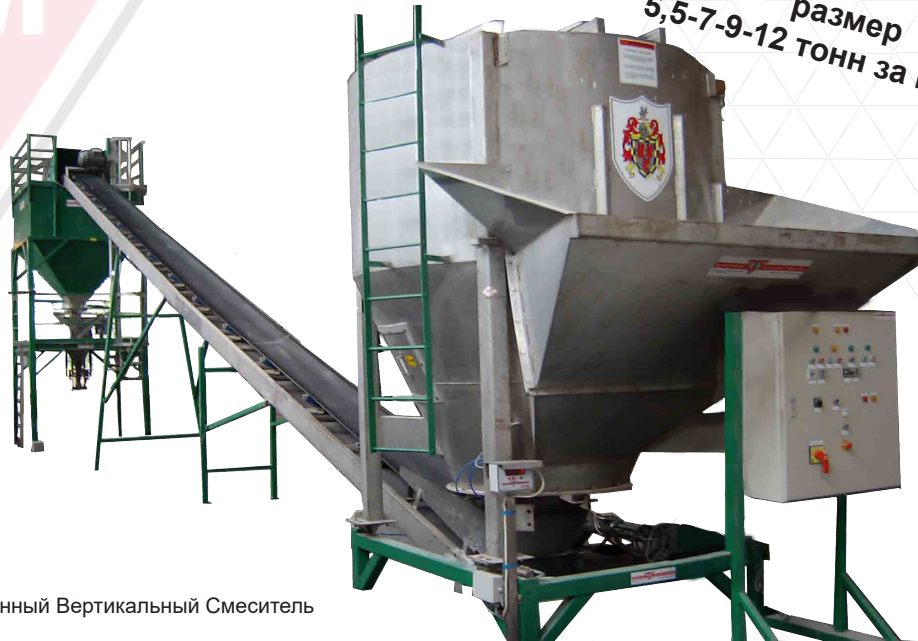
7 тонный Вертикальный Смеситель

Производительность от 25 до 45 тонн/м 3 в час размер 5,5-7-9-12 тонн за партию