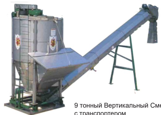
9 тонный Вертикальный Смеситель с транспортером

Смесительный шнек перемещает массу непосредственно в смеситель, где и начинается процесс смешивания. Витки шнека 9 мм толщиной, корпус смесителя изготовлен из нержавеющей стали. Верх смесителя закрыт, тем не менее, на нем установлен инспекционный люк. Несущая конструкция на 4 опорах изготовлена из малоуглеродистой стали. Под каждой опорой установлен тензодатчик. Двигатель с ременно-клиновидной передачей устанавливается за смесителем. Коробка скоростей стоит на вершине смесителя. Дополнительно машина оборудована цифровыми датчиками и большим дисплеем. Производительность вертикального смесителя 5,5 - 7 и максимум 9 тонн/м 3 за партию, производительность в час составляет от 25 до 45 тонн/м 3 . Мы можем внести изменения по вашему желанию.