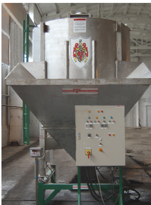
7 тонный Вертикальный Смеситель

Смеситель работает как с гранулированными, так и с порошковыми материалами. Качество получаемой смеси превосходно. После того, как смесь получена, она загружается в линию для затаривания. Данный смеситель из нержавеющей стали, предназначен для работы с небольшими объемами или для помещений с ограниченным пространством. Принцип смешивания этой машины абсолютно уникален. Для процесса смешивания используется конусообразный шнек, его ширина в нижнем отделе составляет 101 см, а в верхнем 55 см, тем самым достигается превосходное качество смеси. Угол наклона нижнего отдела конуса смесителя располагается под углом 60 градусов во избежание скапливания продукта в этом месте. Отгрузка происходит через криволинейный распределитель, расположенный на дне смесителя. Распределитель приводится в движение пневмоцилиндром. Смеситель загружается погрузчиком; исходные материалы предварительно загружаются в бункер. Установленный в бункере экран удерживает комки продукта, камни, любые другие инородные предметы.