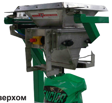
с открытым верхом