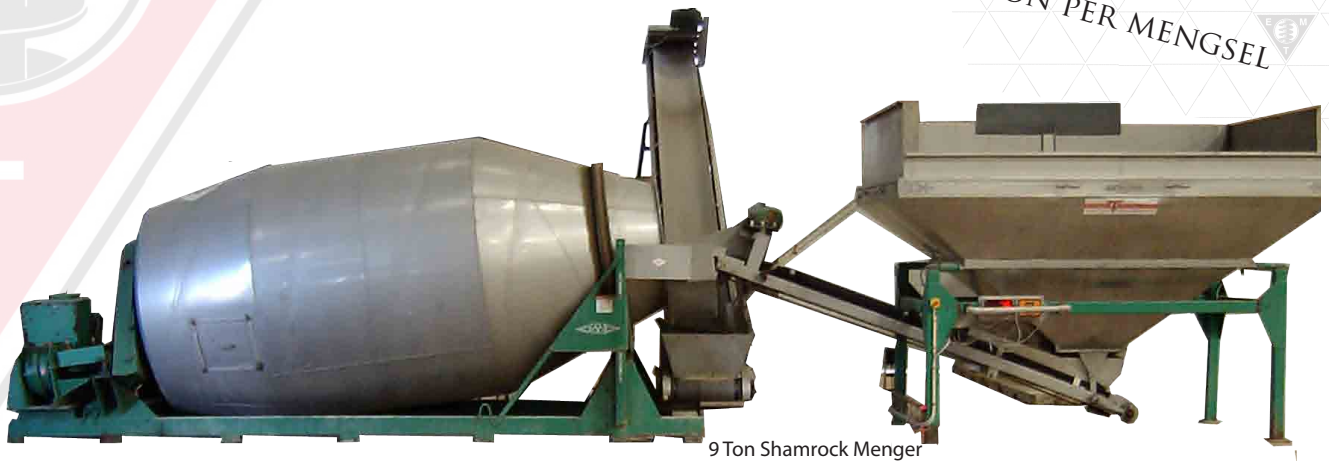
9 Ton Shamrock Menger

CAPACITEIT 20 TOT 70 TON/M 3 PER UUR MACHINE INHOUD 4,5-5,4-7-9-11,5 OF 14 TON PER MENGSEL