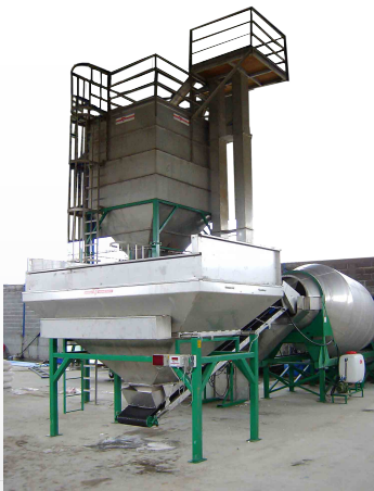
7 Ton Shamrock menger

kunstmest uit de mond van de drum. Het gemengde product wordt dan afgevoerd met een transportband. De drum blender is geïnstalleerd op een normaal stalen frame van koker profiel staal. De Shamrock blender wordt aangedreven door een elektro motor die geplaatst is op het ondersteunings frame. In de weegschaal is een normaal stalen zeef geplaatst om verontreiniging op te vangen. De weegschaal heeft een open top zodat hij gevuld kan worden door een loader. De blender afmeting zijn 4,5-5,4-7-9-11,5 en 14 ton/m 3 per charge met een capaciteit van 25 tot 70 ton/m 3 per uur. Deze menger kan aangepast worden aan de wensen van de klant.