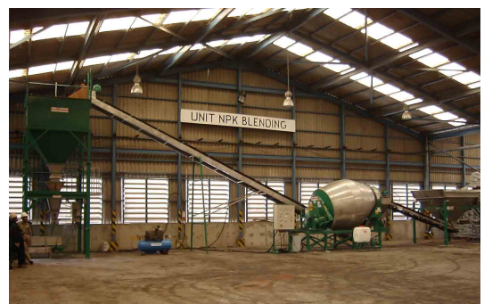
4,5 ton Shamrock menger

drum waar het de machine in loopt. De blender begint dan te draaien met de klok mee om te mengen. In de menger zijn schoepen gemaakt die ervoor zorgen dat het product zeer goed gemengd wordt. Als het mengsel klaar is draait de blender de andere kant op en komt door de inwendige schoepen alle gemengde