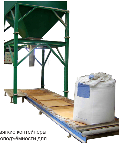
Экономик - мягкие контейнеры средней грузоподъемности для насыпных грузов / БигБэг

его заполнения. Весовая система оборудована индикатором от Эйвери Солтер Вейтроникс (Avery Salter Weight-honix). Вы можете управлять системой как автоматически, так и вручную. Система работает на пневматических цилиндрах из нержавеющей стали и стеклопластика. Машину можно заказать в нескольких конфигурациях. Аппарат Биг Бэг экономик - стационарная машина с зафиксированным бункером для хранения над ней. Второй вариант - это Биг Бэг Лоу Профайл - передвижная установка. Не составит труда переместить ее на новое место при помощи вилочного погрузчика, продукты так же с легкостью загружаются непосредственно в бункер, минуя стадию хранения, как в вышеуказанном варианте. Производственные мощности обеих систем - 30 тонн в час с мешками в 1000 кг и приблизительно 50 мешков объемом в 500 кг. По желанию заказчика мы можем внести изменения в конфигурацию машины.