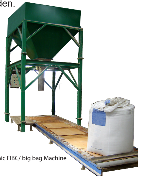
Economic FIBC/ big bag Machine

Als de zak vol is wordt deze door middel van een roltransportband weggevoerd. Het weegsysteem werkt met een weegindicator van Avery Salter Weightronix. De hele machine kan automatisch en handmatig worden bediend. De machine is uitgevoerd met pneumatisch roestvast stalen en Fiberglas cilinders. De Big Bag Economic is een vaste machine met een voorraadbunker bovenop. De Big Bag Low Profile is een machine die d.m.v. een heftruck verplaatst kan worden. De machines kunnen met een heftruck schepbak direct in de weegbunker worden gevuld. De capaciteit van beide systemen zijn 30 ton per uur met zakken van 1.000 kg en ongeveer 50 zakken van 500 kg per uur. Deze machines zijn verkrijgbaar in verschillende opstellingen en kunnen aan de wensen van de klant aangepast worden.