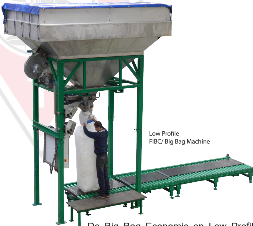
Low Profile FIBC/ Big Bag Machine

De Big Bag Economic en Low Profile Unit zijn gemaakt om FIBC (Flexible, Intermediary, Bulk, Containers) zakken te vullen. De machine weegt en vult automatisch en kan 100 tot 1.250 kg zakken vullen. Deze machine is geschikt voor poeder en gegraneerd materiaal. De voorraadbunker staat op 4 H-profiel poten en is voorzien van een pneumatische schuif met grote en kleine openingen. De voorraadbunker lost in de roestvast stalen pijp die in de Big Bag past. De Big Bag staat op een platform weegschaal op de vloer. De Big Bag dient met de hand om de vulpijp vastgehouden worden, zodat er tijdens het vulproces geen stof vrijkomt. De hoogte van de vulpijp is verstelbaar over een lengte van 400 mm. Voor het vullen begint, blaast een blower lucht in de zak totdat de zak goed open geblazen is. Vervolgens valt het product in de zak. De load cell weegschaal op het platform bepaalt het gewicht van het product.