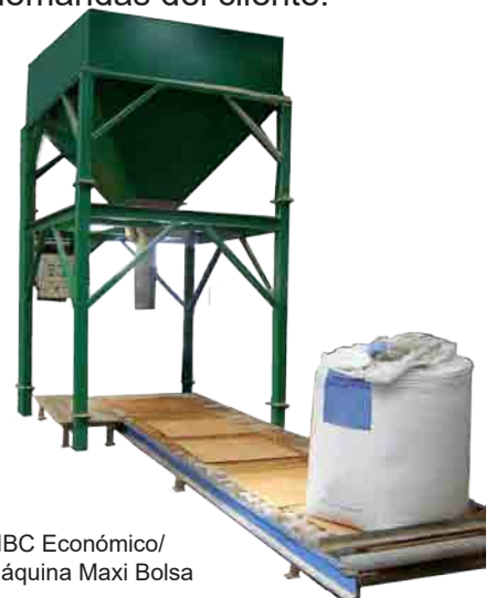
FIBC Económico/ Máquina Maxi Bolsa

Cuando la bolsa se llena, un transportador de rodillos transporta la bolsa. El sistema de báscula funciona con un indicador de peso de Avery Salter Weightronix. Toda la unidad se puede operar de forma manual o automática. La unidad funciona con cilindros neumáticos de acero inoxidable y de fibra de vidrio. La máquina está disponible en dos configuraciones posibles. La Maxi Bolsa Económica es una máquina fija con una tolva de almacenamiento encima. La Maxi Bolsa De Perfil Bajo es una máquina portátil que se puede mover con un montacargas. La tolva puede llenarse directamente con una pala cargadora. Las capacidades de ambos sistemas son de 30 toneladas por hora con Maxi Bolsas de 1000 kg y 50 bolsas de 500 kg por hora aprox. Este producto se puede ajustar a las demandas del cliente.