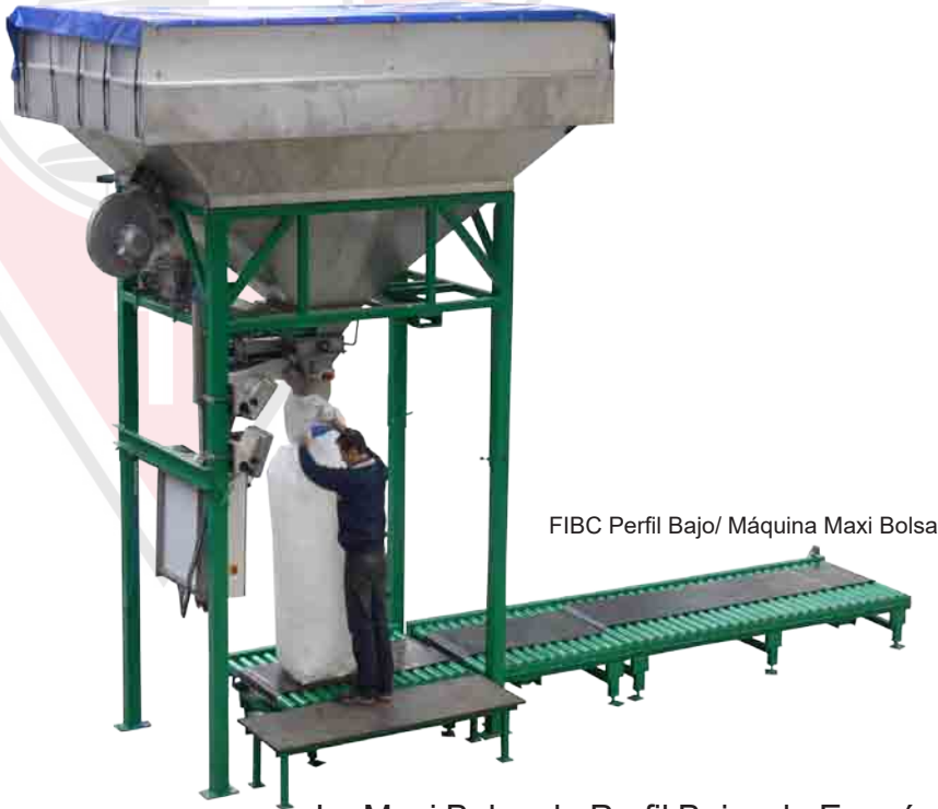
FIBC Perfil Bajo/ Máquina Maxi Bolsa

La Maxi Bolsa de Perfil Bajo y la Económica son fabricadas para llenar bolsas FIBC (Flexible, Intermedio, Granel, Contenedor). La máquina pesa y llena automáticamente bolsas de 100 a 1250 kg. Esta máquina es apropiada para materiales en polvo y granulados. La tolva de almacenamiento se apoya en 4 patas de perfil en H. Los materiales se colocan dentro de la tolva de almacenamiento. Se ha montado una válvula neumática debajo de la tolva de almacenamiento. Esta válvula tiene una abertura grande y una fina. La tolva se descarga en una tubería de acero inoxidable que cabe en una Maxi Bolsa. La Maxi Bolsa está sobre una plataforma en el suelo. La altura del tubo de llenado es ajustable en una longitud de 400 mm. La Maxi Bolsa debe sostenerse y cerrarse manualmente alrededor del tubo de llenado. Al utilizar este sistema, no se libera polvo durante el proceso de llenado. Antes de que comience el proceso de llenado, un soplador infla con aire la bolsa. Cuando la bolsa obtiene su tamaño