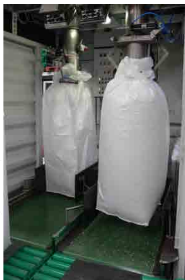
REPLISSAGE DES BIG BAGS A L'INTERIEUR DU CONTAINER