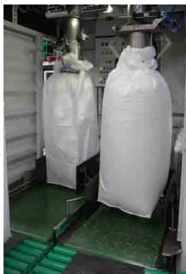
Заполнение мешков в контейнере