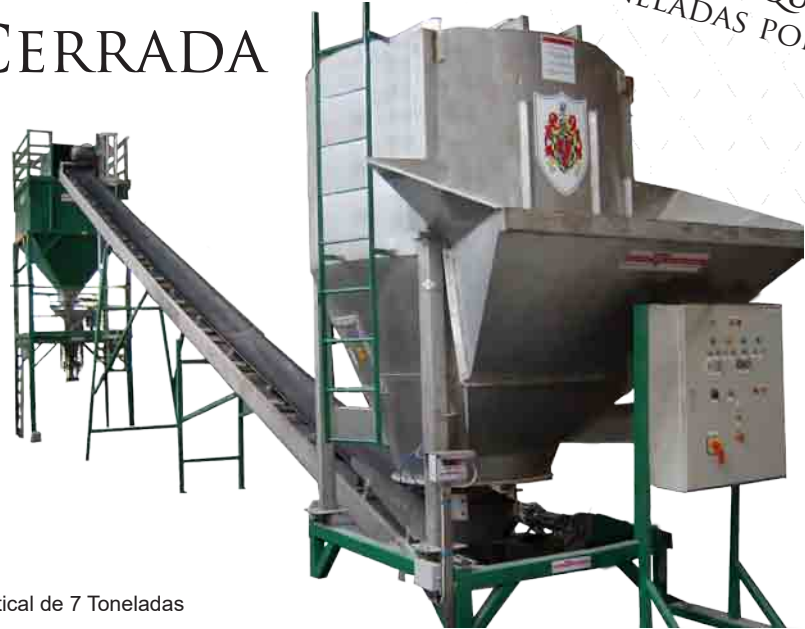
Mezclador Vertical de 7 Toneladas

CAPACIDAD 25 A 45 TONELADAS/M3 POR HORA TAMAÑO DE LA MÁQUINA 5,5-7-9-12 TONELADAS POR LOTE