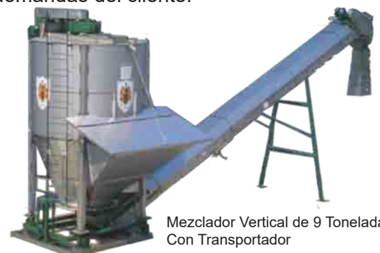
Mezclador Vertical de 9 Toneladas Con Transportador

Este producto se puede ajustar a las demandas del cliente.