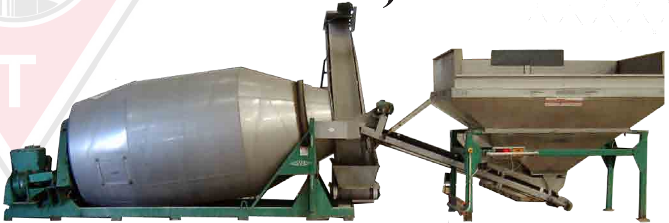
9 Ton Shamrock Blender

CAPACIDAD 20 A 70 TONELADAS/M3 POR HORA TAMAÑO DE LA MÁQUINA 4,5-5,4-7-9-11,5 O 14 TONELADAS POR LOTE