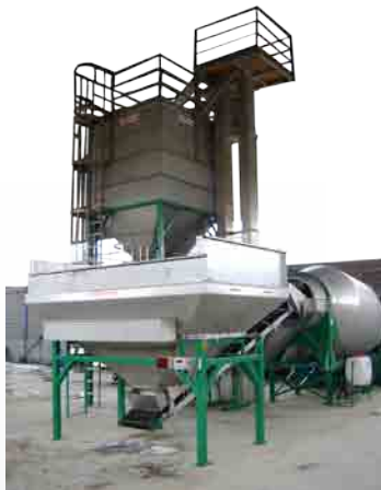
7 Ton Shamrock Blender

El Mezclador de Tambor Shamrock es impulsado por un motor eléctrico que está instalado en el marco de soporte. Dentro de la tolva báscula se coloca una malla de acero dulce para atrapar grumos. La tolva tiene la parte superior abierta para llenar con una pala cargadora. Los tamaños del mezclador son 4,5 - 5,4 - 7 - 9 - 11,5 o 14 toneladas / m 3 por lote con una capacidad de 25 a 70 toneladas / m 3 por hora. Este producto se puede ajustar a las demandas del cliente.