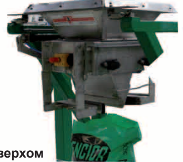
с открытым верхом