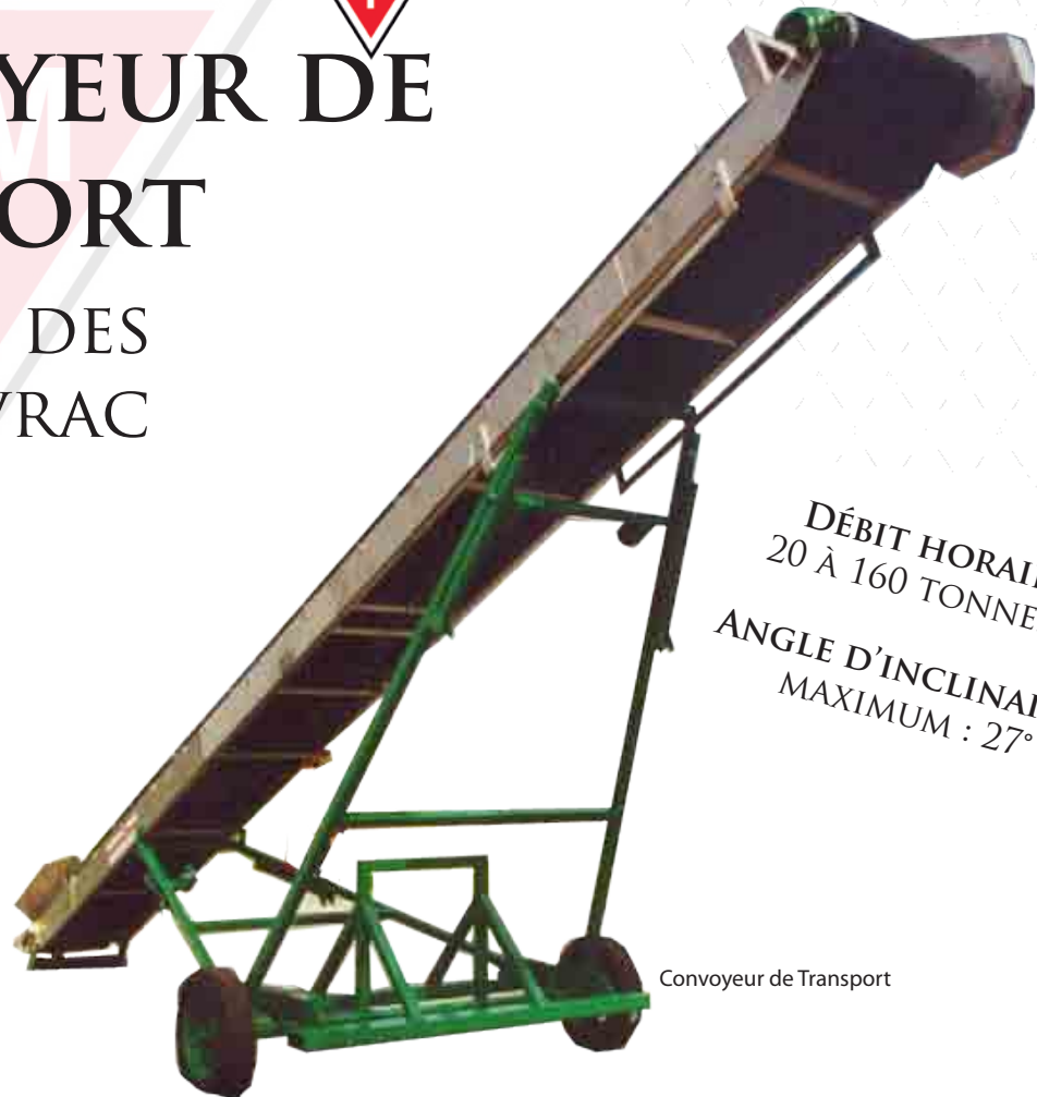
Convoyeur de Transport

DÉBIT HORAIRE : 20 À 160 TONNES/M 3 ANGLE D'INCLINAISON MAXIMUM : 27°