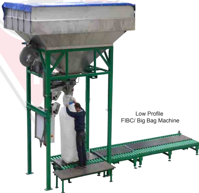
Low Profile FIBC/ Big Bag Machine

SACS DE 100 À 1250 KILOS DEBIT HORAIRE: 30 À 40 TONNES/M 3 60 SACS