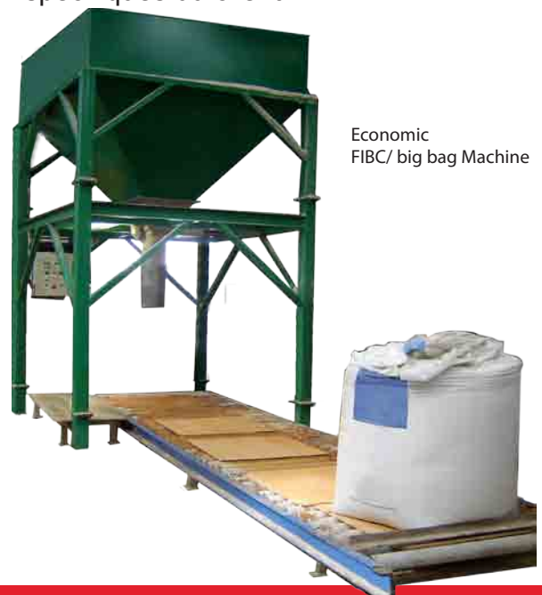
Economic FIBC/ big bag Machine

L'appareil peut opérer automatiquement ou manuellement. Les vannes et vérins pneumatiques sont en inox et fibres de verre. La machine peut être fabriquée en différentes variations : Le Big bag Economic est une machine fixe avec une trémie tampon en tête et le Big bag Low Profile est une machine mobile qui peut être déplacée à l'aide d'un chariot élévateur. Les 2 systèmes sont d'un débit horaire de 30 tonnes (sacs d'une tonne) ou 40 à 50 sacs de 500 kilos. Ils peuvent être adaptés aux besoins spécifiques du client.