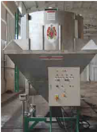
mélangeur vertical 7 tonnes

continuellement et correctement. En bas, la cuve du mélangeur est conique, inclinaison de 60°, afin d'éviter le colmatage du produit à l'intérieur de la machine. Un tiroir en-dessous du mélangeur, en forme de demi-lune, en combinaison avec un racleur efficace en bas de la vis, garantit une vidange complet. Ce tiroir est entraîné par un vérin pneumatique. La trémie d'entrée, en inox, se trouve du côté latéral du mélangeur et est alimentée par godet de bull ou chariot élévateur. Cette trémie est également équipée d'une grille qui élimine les trop grandes mottes et d'autres corps étrangers comme p.e. des morceaux de bois, pierre..etc. La vis tire les matières premières vers l'intérieur du mélangeur. La vis est fabriquée en acier doux de 9 mm d'épaisseur et la cuve en inox. La tête du mélangeur est fermée et est équipée d'un trou d'homme. La machine est posée sur 4 profils de support et un châssis en acier doux.