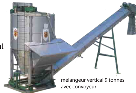
mélangeur vertical 9 tonnes avec convoyeur

Chaque profil est posé sur un capteur de poids électronique en inox. Un réducteur à pignons se trouve en tête du mélangeur et il est entraîné par un moteur électrique, monté à côté de la cuve, avec poulie à gorges et courroies V. Un indicateur digital de poids et un lecteur à grands chiffres sont également monté sur la machine. Le mélangeur existe en 3 volumes : 5,5 - 7 et 9 m 3 /tonnes par charge et le débit horaire peut varier de 25 à 45 tonnes. La machine peut être adaptée aux besoins spécifiques du client.