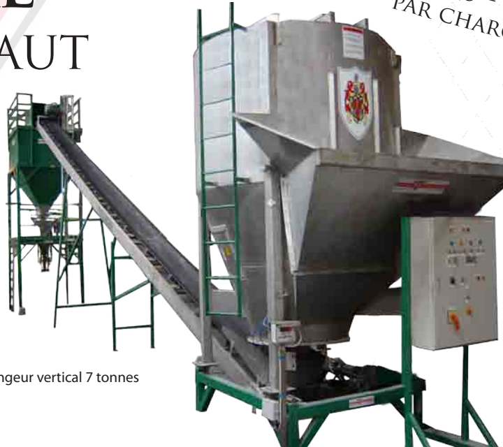
mélangeur vertical 7 tonnes

DEBIT HORAIRE : 25 à 40 TONNES/M 3 5,5 - 7 - 9 - 12 M 3 CAPACITÉS : SUIVANT MODÈLE : 5,5 - 7 - 9 - 12 TONNES PAR CHARGE