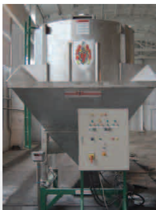
7 Ton Vertical Blender

De machine staat op 4 poten en een heeft weeg frame van normaal staal. Onder iedere poot is een roestvast stalen load cell gemonteerd. Aan de bovenkant van de menger is de tandwielkast gemonteerd. De motor is naast de menger geplaatst en wordt aangedreven door v-riemen. De machine heeft een digitale indicator en een groot aflees display. De Vertical menger heeft een capaciteit van 5,5 tot 7 en maximum 9ton/m 3 per charge, met een capaciteit van 25 tot 45 ton/m 3 per uur. Deze menger kan aangepast worden aan de wensen van de klant.