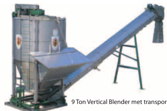
9 Ton Vertical Blender met transportband