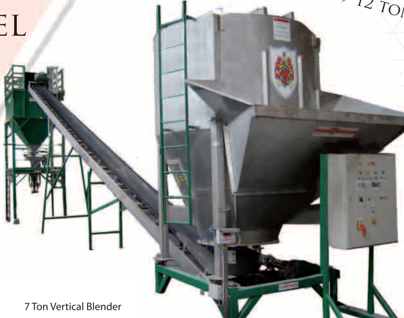
7 Ton Vertical Blender

CAPACITEIT 25 TOT 45 TON/M 3 PER UUR MACHINE INHOUD 5,5-7-9-12 TON PER MENGSEL